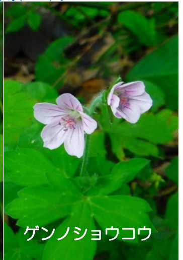
ゲンノショウコウ