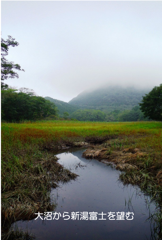
大沼から新湯富士を望む