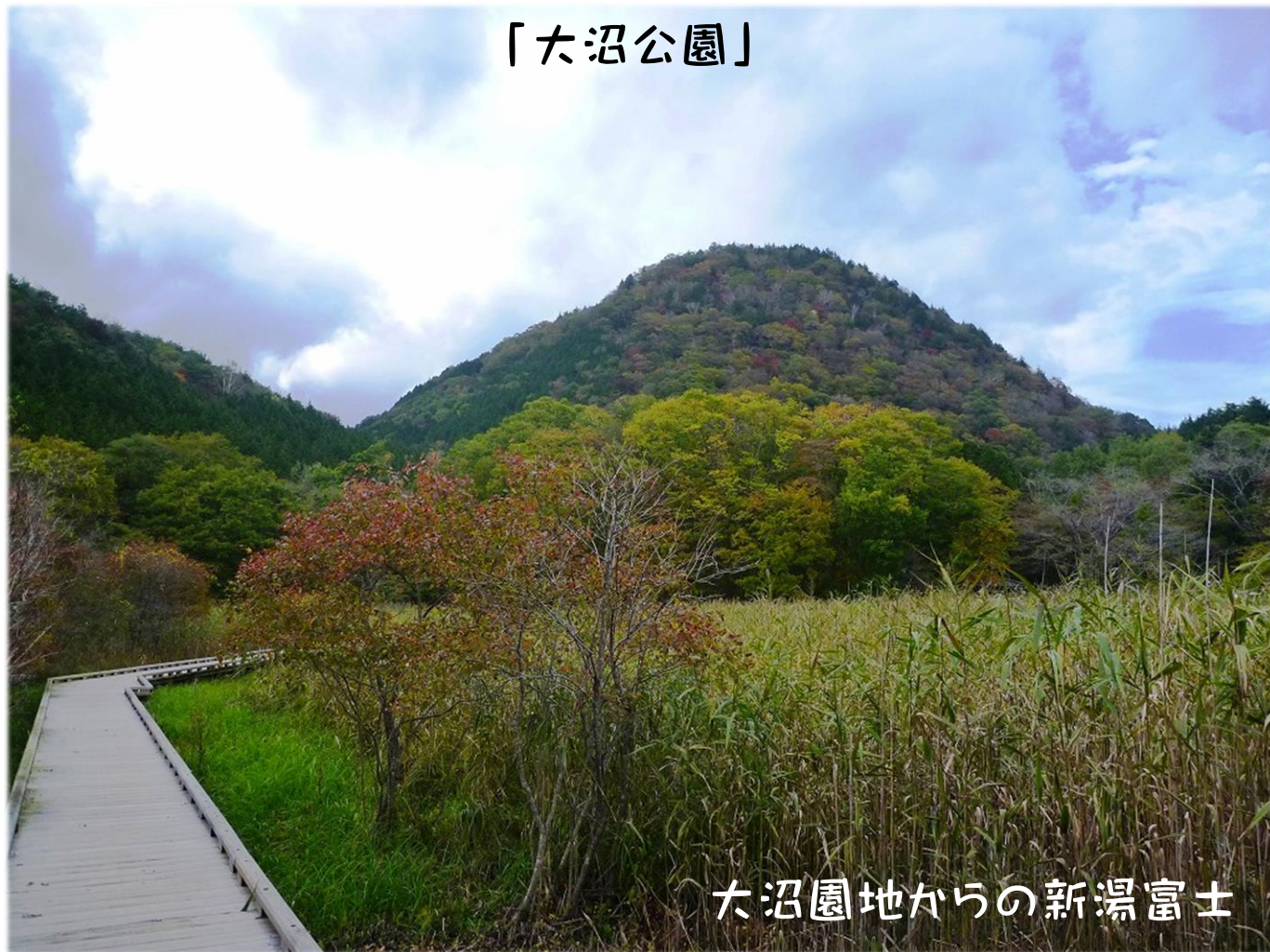
大沼園地からの新湯富士