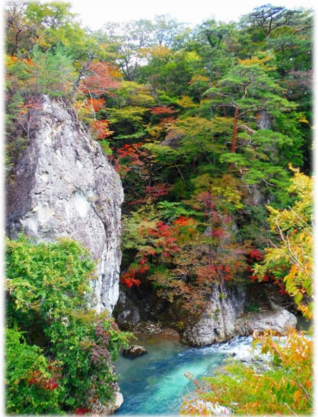
四季の里橋より 「鹿股川」 鹿股橋より