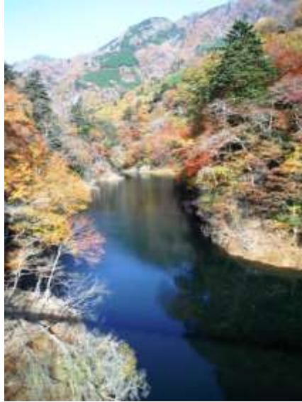
回顧吊橋より箒川溪谷