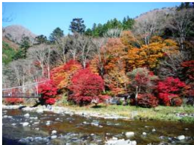
ご存じ紅の吊橋対岸の景勝地！ (古町地区もの語り間対岸)