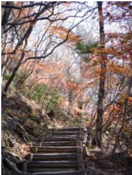
留春の滝目指して紅葉狩り!