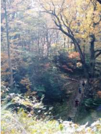
紅葉の溪谷を目指して!