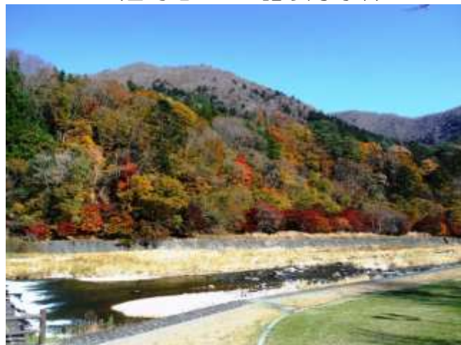
もの語り館より箒川上流 (古町地区5丁目県駐対岸)