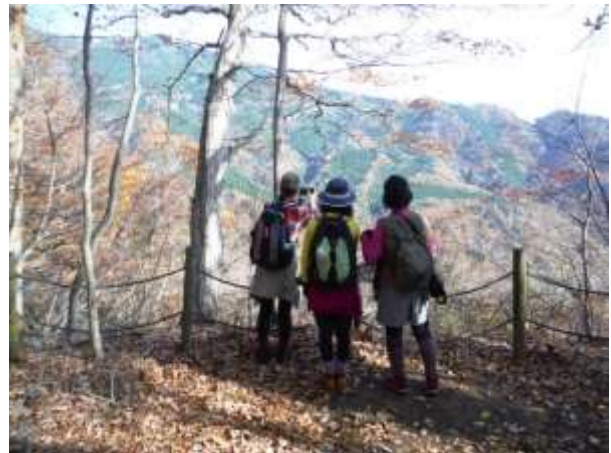
紅葉狩りをしながら回顧コース展望台へ!