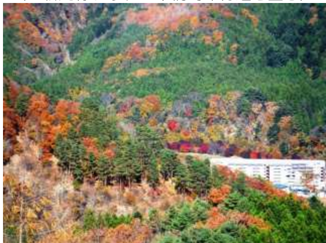
箒川の流れて紅葉に染まる温泉街！ (旧新元線より古町地区県駐対岸付近を望む)