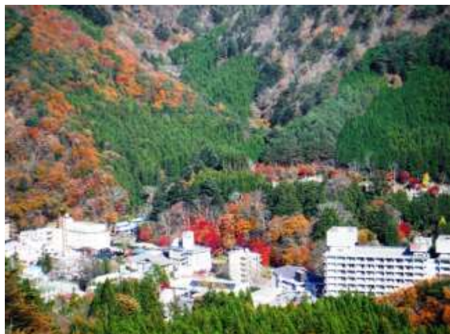
箒川の流れて紅葉に染まる温泉街！ (旧新元線より紅の吊橋対岸付近を望む)

見てください！塩原温泉郷が「もみじの渓谷」・「もみじの谷」と言われる由縁が分かります。