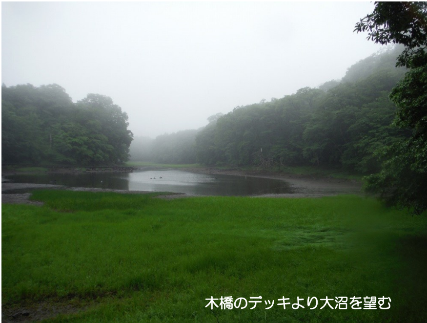
木橋のデッキより大沼を望む