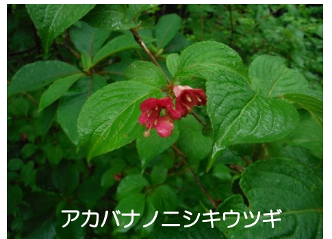
アカバナノニシキウツギ