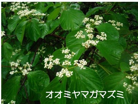
オオミヤマガマズミ