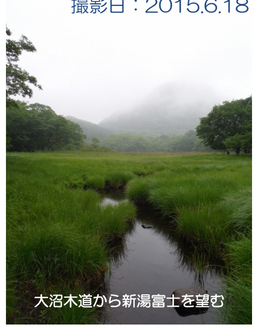
大沼木道から新湯富士を望む