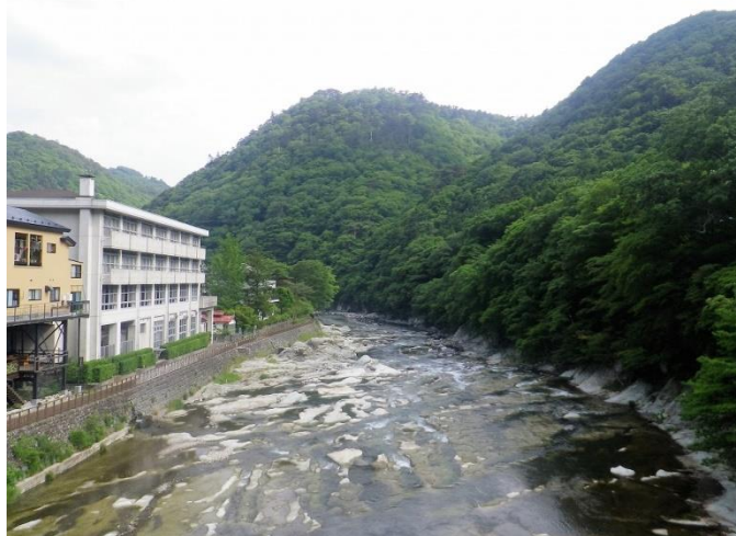
福渡橋より伯耆川を望む（福渡地区）