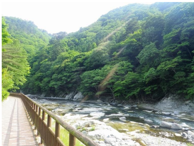
やしおコース：福渡地区を歩く