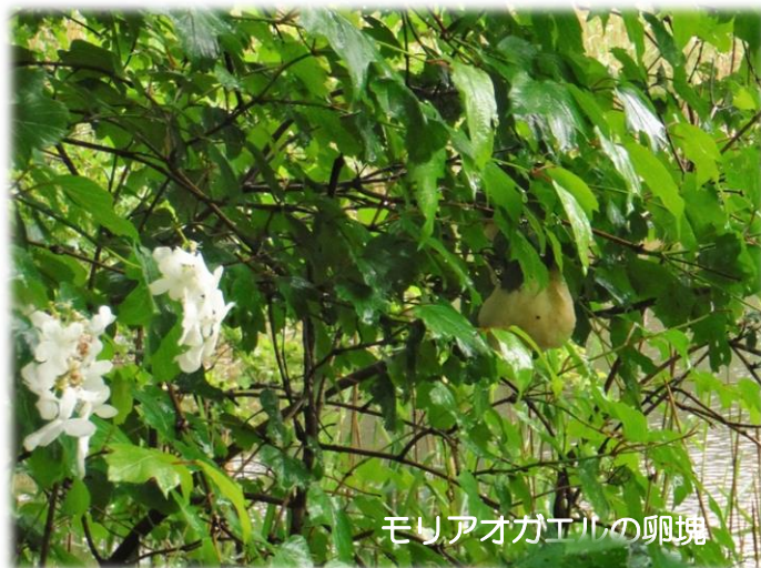
モリアオガエルの卵塊