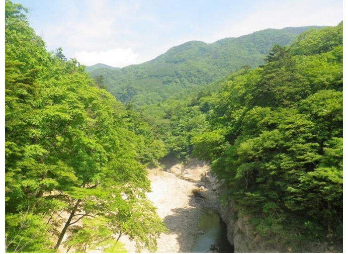
墓石園地から回顧コースへ！ 回顧コース：回顧の吊り橋から伯耆川溪谷をのぞむ