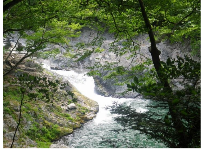
塩原溪谷遊歩道でみられる三滝：左から回顧の滝、留春の滝、布滝