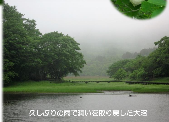
久しぶりの雨で潤いを取り戻した大沼

雨が降りしきる大沼の木道脇で・・・。 モリアオガエルの声を聴きながら観察をしてきました。 その神秘の行動は、まだ始まったばかり。 木道から撮影できました。 けして邪魔をしないでくださいね。 自然公園マナーを守って観察願います。