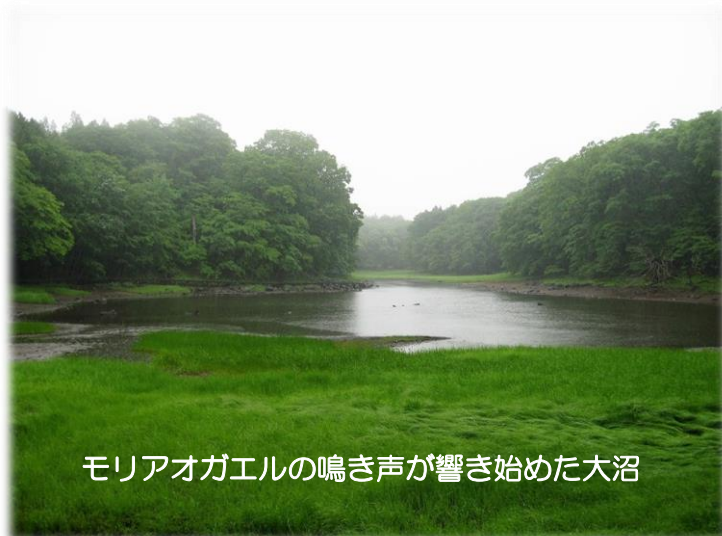
モリアオガエルの鳴き声が響き始めた大沼