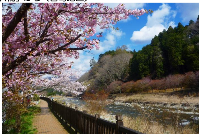
温泉街の箒川沿いの歩道を歩く。塩原溪谷遊歩道（古町地区）