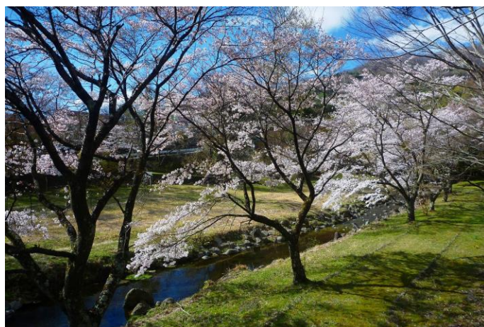
国道 400 号沿い。「追沢橋」から（古町地区）