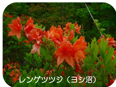
レンゲツツジ (ヨシ沼)