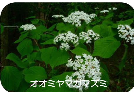
オオミヤマガズミ