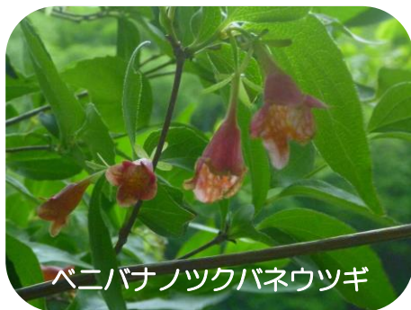
ベニバナノツクバネウツギ