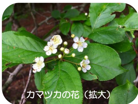
カマツカの花 (拡大)