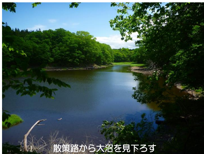
散策路から大沼を見下ろす