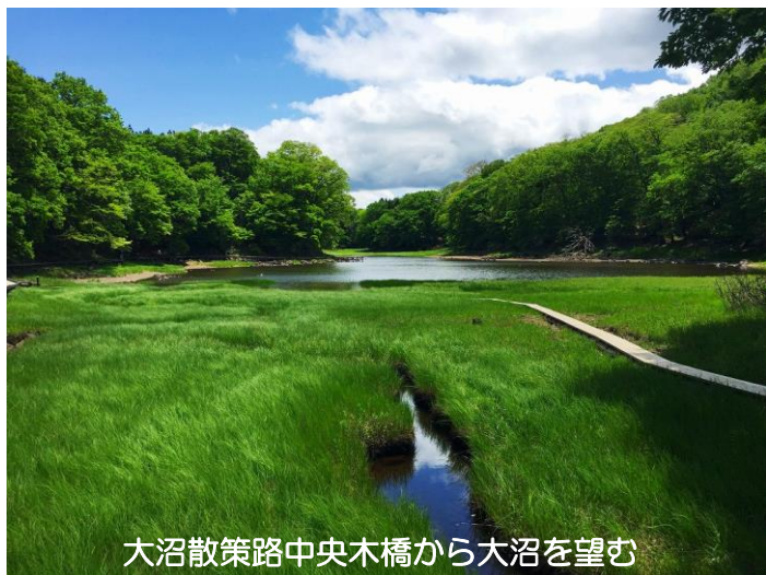
大沼散策路中央木橋から大沼を望む