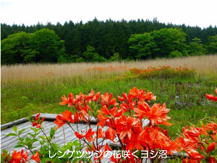
レンゲツツジの花咲くヨシ沼

エゾハルゼミとモリアオガエルの声が響き渡る、大沼公園では、今年もモリアオガエルの産卵が始まりました。その営みを静かに見守ってください。卵塊(らんかい)が観察できます。