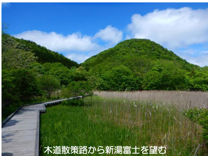
木道散策路から新湯富士を望む