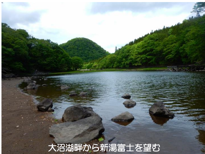
大沼湖畔から新湯富士を望む