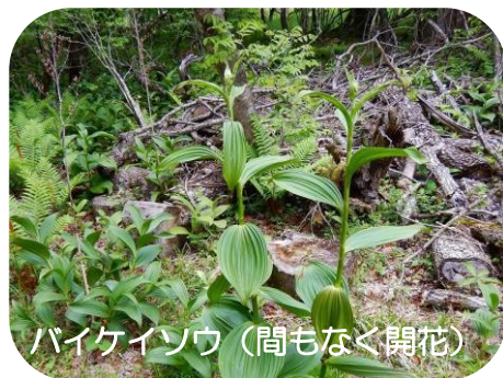
バイケイソウ (間もなく開花)