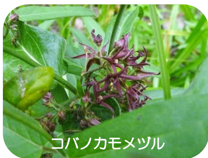
コバノカモメヅル