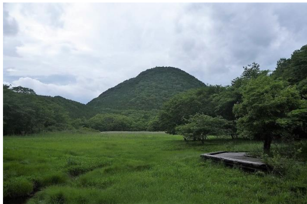
大沼から新湯富士を望む

自然研究路随一のビュースポットと観察ポイント！じっくり初夏の森時間をお過ごしください。