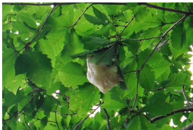
モリアオガエルと卵塊(らんかい)。散策路木道より