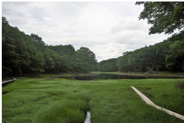
大沼：中央木橋から