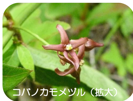
コバノカモメヅル (拡大)