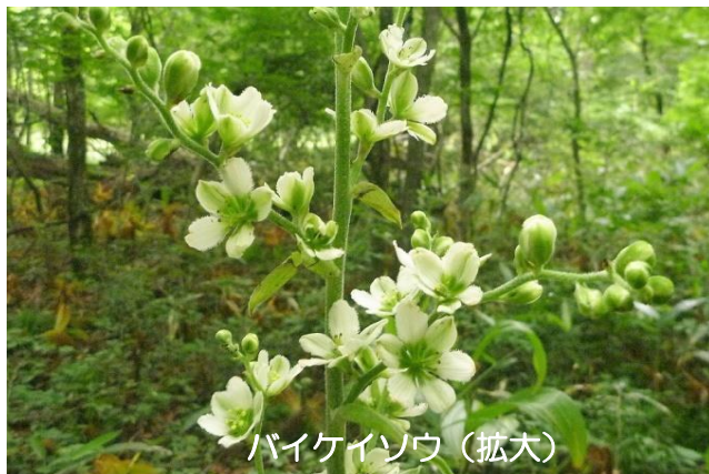
バイケイソウ (拡大)