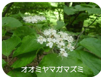
オオミヤマガズミ