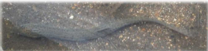
大沼で発見!! ドジョウのオス (左) とメス (右)