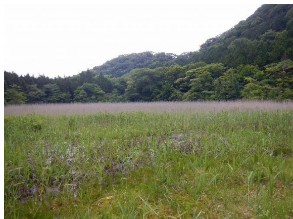
ヨシ沼：観察デッキより