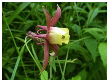
オオヤマオダマキ