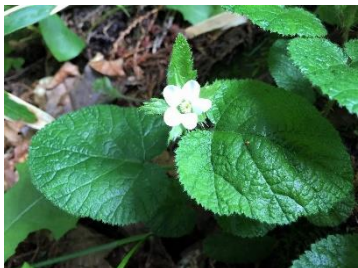
マルバフユイチゴ