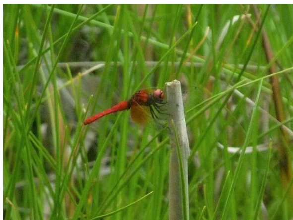
ハッチョウトンボ(オス)