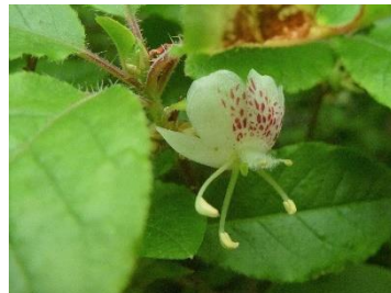
バйкаツツジ(拡大写真)