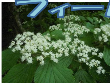
オオミヤマガズミ