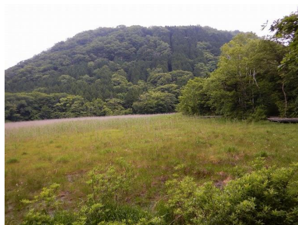
ヨシ沼から新湯富士を望む