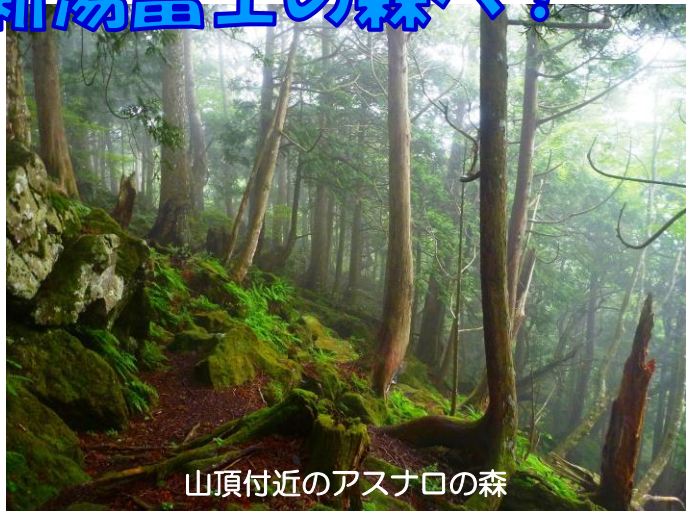
山頂付近のアスナロの森

塩原自然研究路のシンボル「新湯富士」。大沼からのその山 様はご存じの方も多はず。その森を堪能してください。