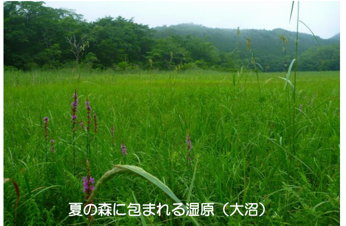
夏の森に包まれる湿原(大沼)