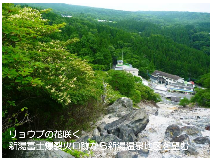
リョウブの花咲く 新湯富士爆裂火口跡から新湯温泉地区を望む