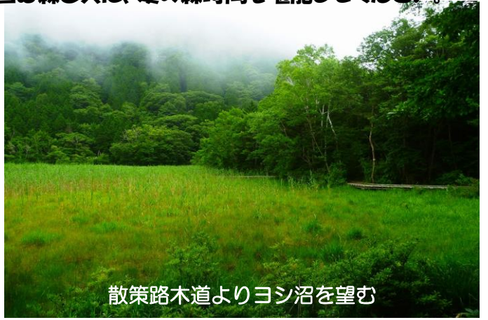
散策路木道よりヨシ沼を望む