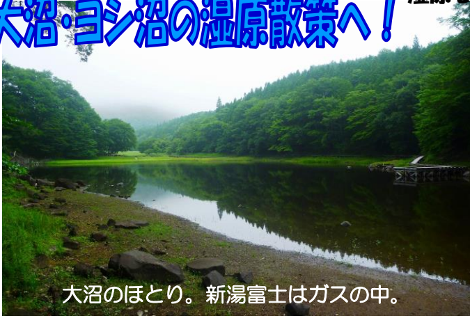
大沼のほとり。新湯富士はガスの中。

新湯富士のふもとに点在する湿原。 湿原を囲む森と共に、夏の森時間を堪能してください。