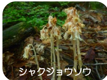
シャクジョウソウ