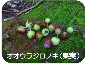
オオウラジロノキ (果実)