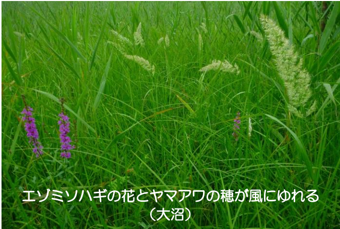
エソミソハギの花とヤマアワの穂が風にゆれる (大沼)