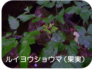
ルイヨウショウマ (果実)