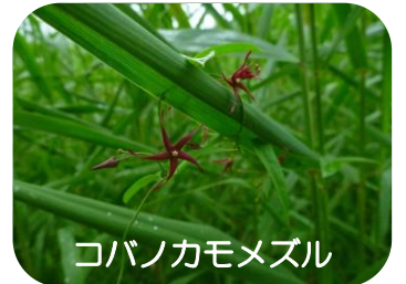
コバノカモメズル