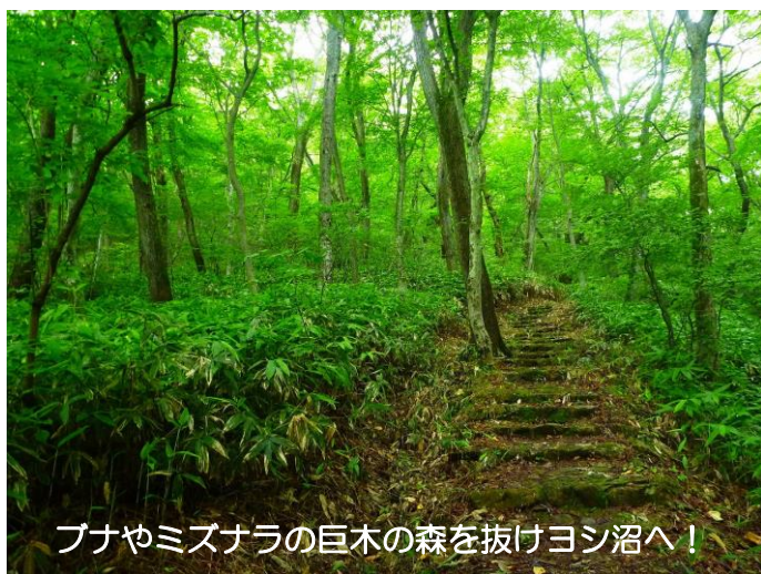
ブナやミズナラの巨木の森を抜けヨシ沼へ!