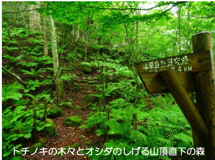
トチノキの木々とオシダのしげる山頂直下の森