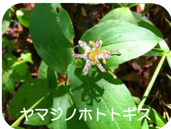
ヤマジノホトトギス