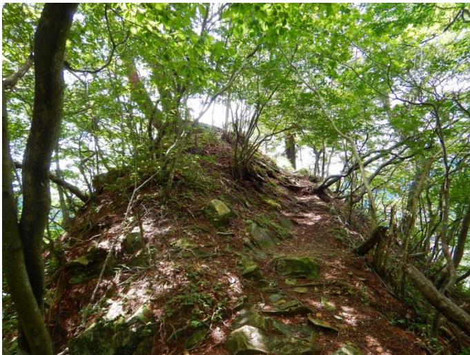
天狗岩コース・・・岩の山頂まであと少し！