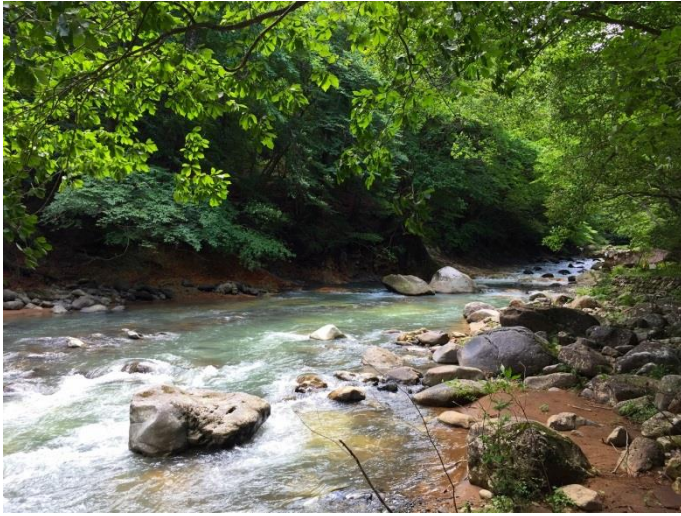
鹿股川溪谷 (前山歩道)

ビジターセンターを拠点に散策できる遊歩道の森。 前山歩道では、箒川の支流「鹿股川溪谷」の涼を堪能！ 箒川溪谷や、ビジター施設から見える一枚岩の山。 登りたくなりませんか？天狗岩コース！