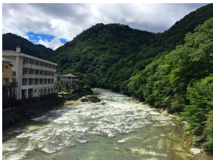
溪谷遊歩道やしおコース福渡吊橋からの箒川溪谷