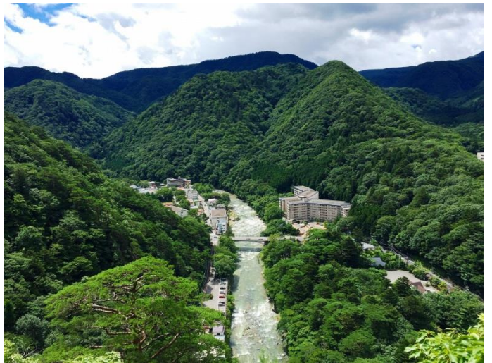
天狗岩コース・・・山頂からの眺望！