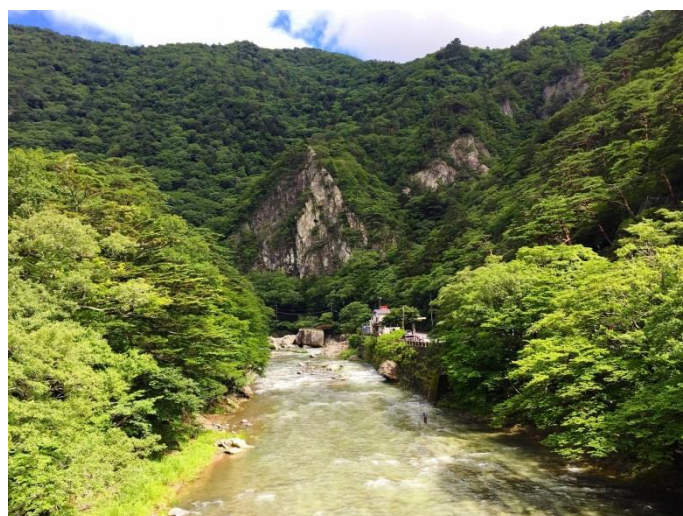
溪谷遊歩道やしおコース福渡橋からの箒川と天狗岩