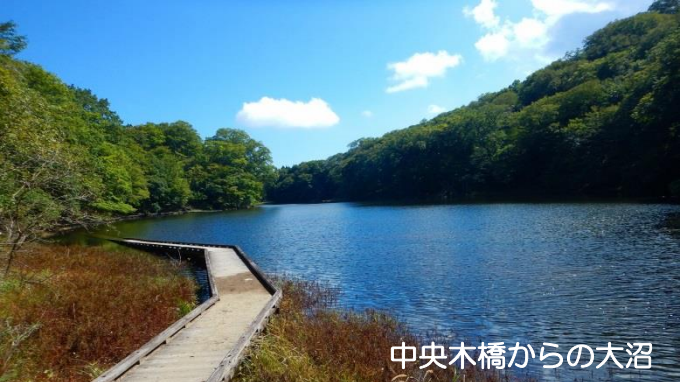
中央木橋からの大沼