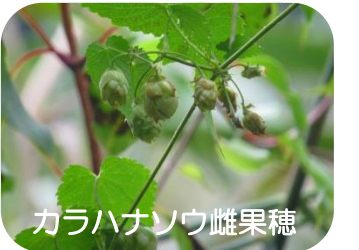
カラハナソウ雌果穂