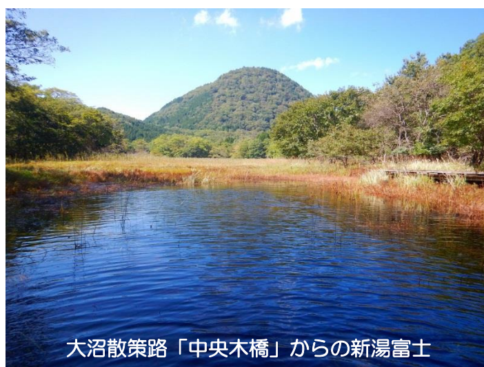
大沼散策路「中央木橋」からの新湯富士