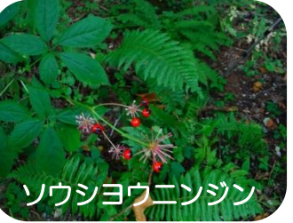
ソウショウニンジン