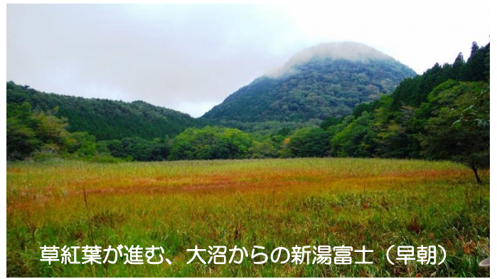
草紅葉が進む、大沼からの新湯富士（早朝）