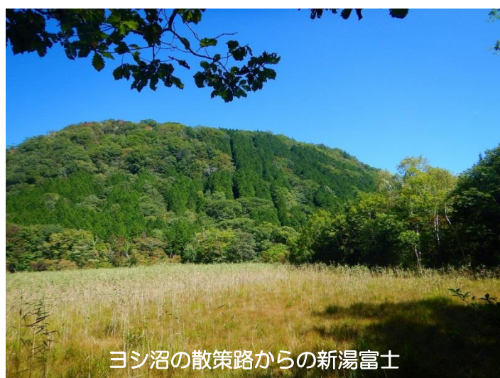
ヨシ沼の散策路からの新湯富士