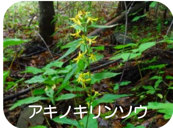
アキノキリンソウ