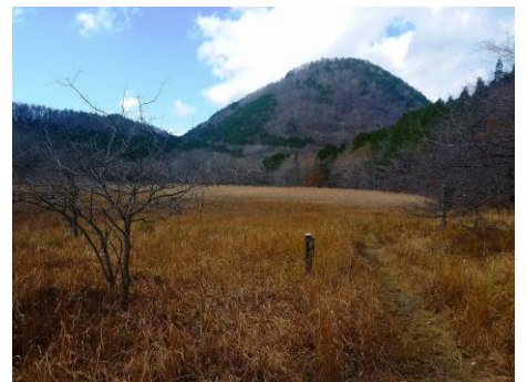
散策路からの新湯富士