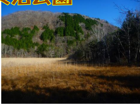
ヨシ沼散策路からの新湯富士