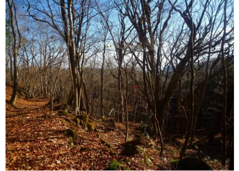
新湯富士山麓の散策路