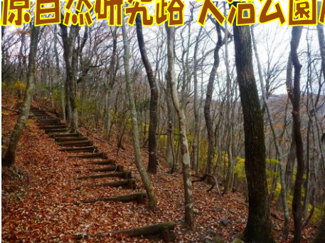
研究路散策路の様子・・・落葉を踏みしめながら。