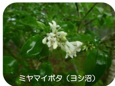
ミヤマイボタ (ヨシ沼)