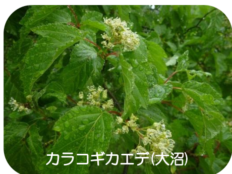
カラコギカエテ(大沼)