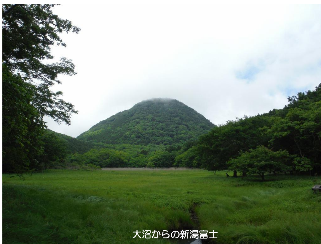
大沼からの新湯富士