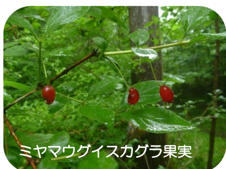
ミヤマウグイスカグラ果実