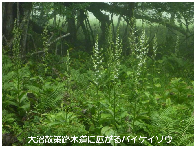
大沼散策路木道に広がるバイケイソウ