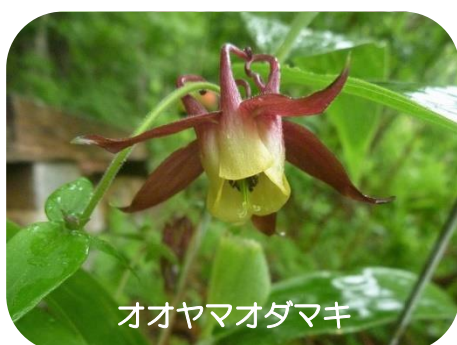
オオヤマオダマキ