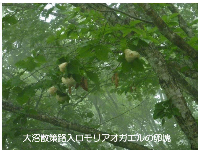
大沼散策路入口モリアオカエルの卵塊