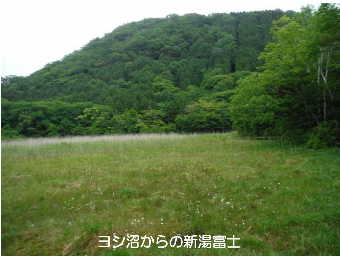
ヨシ沼からの新湯富士

モリアオガエルの声が響き渡る、大沼公園では今年も、もうすぐ産卵が始まります。その営みを静かに見守ってください。