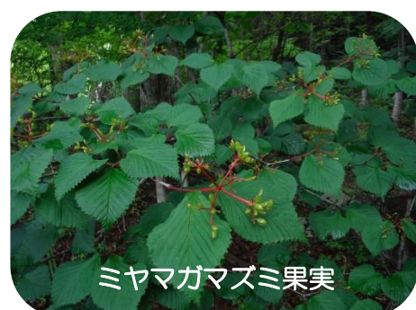
ミヤマガマズミ果実