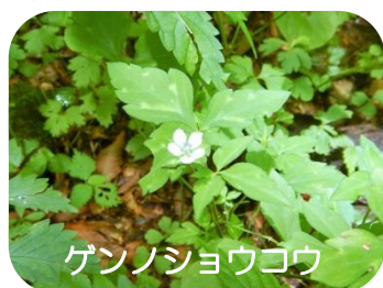
ゲンノショウコウ