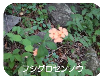
フシグロセンノウ