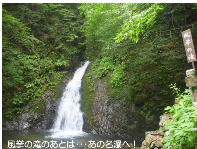
風拳の滝のあとは・・・あの名瀑へ！

塩原溪谷随一の名瀑を訪ねてください。溪谷全体でマイナスイオンを感じることができますよ！