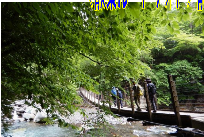
鹿股川溪谷に架かる「仙人岩吊橋」 箒川溪谷とは違う溪谷景観を堪能できます。