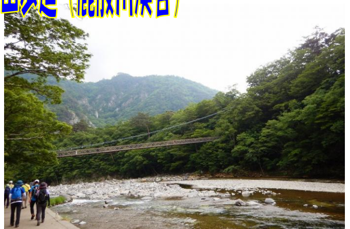
ビジターセンター対岸の箒川溪谷「七つ岩吊橋」が 見えてきました。間もなく周回コースも終わります。