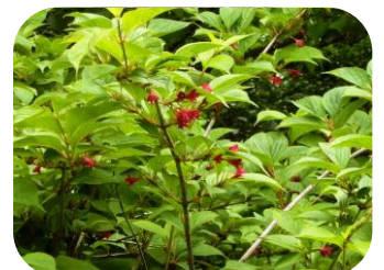
ベニバナニシキウツギ