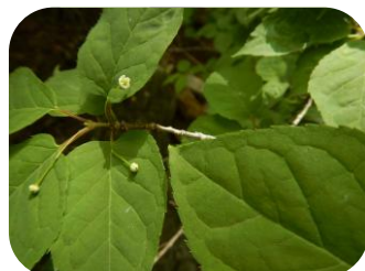
フウリンウメモドキ