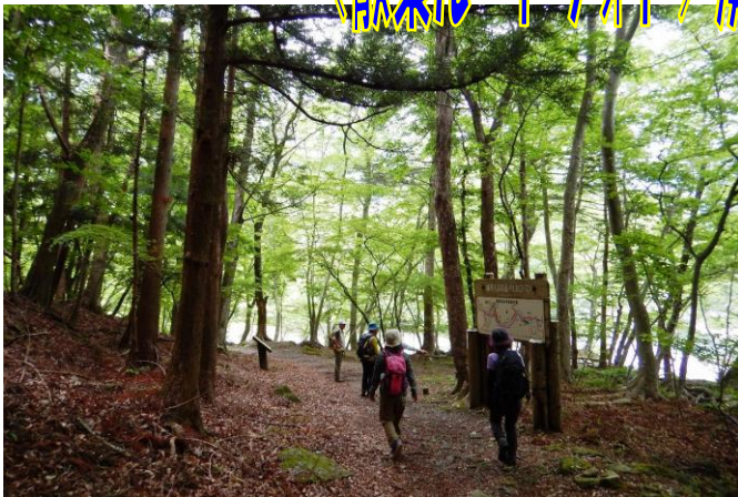
箒川ダム園地からビジターセンターを目指しました。 溪谷の森には涼しい川風が吹いていました。