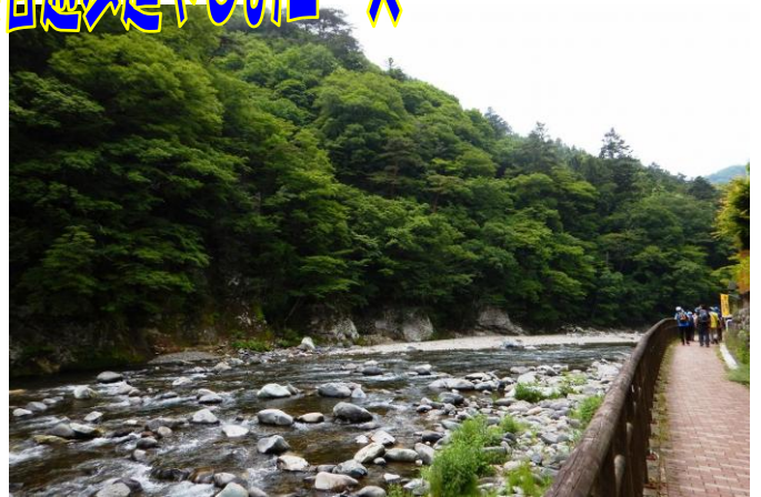
福渡温泉地区 不動吊橋上流付近の溪谷沿いの遊歩道。 間もなくビジターセンターです。