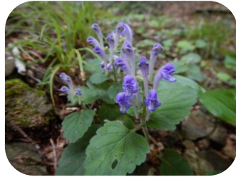
オカタツナミソウ