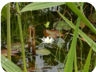
シツジグサ (ヨシ沼)