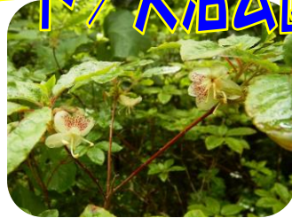
バイカツツジ (花拡大)