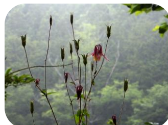
オオヤマオダマキ