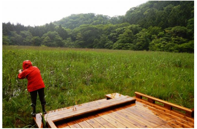
観察デッキからハッチョウトンボ観察