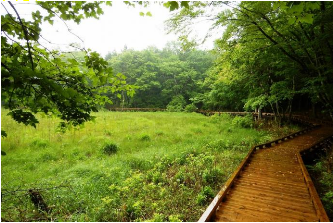
ヨシ沼散策路と湿原エリア

■ヨシ沼は、塩原地区において、ここでしか観察できない動植物の自生地、生息地となっています。大沼とはまた違った森と景観がございます。