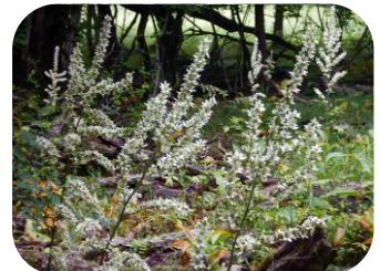
バイケイソウ (花拡大)