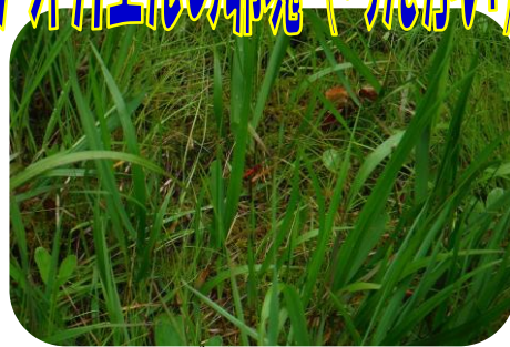
ハッチョウトンボどこにいるかわかりますか？