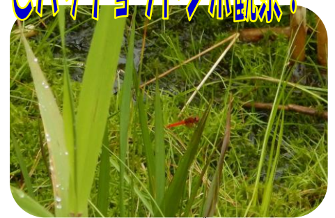
ハッチョウトンボ♂ 拡大

《モリアオガエルの卵塊とハッチョウトンボ観察について》 散策路からじっくり観察をお願いします。