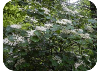
オオミヤマガマズミ