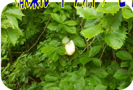
モリアオガエルの卵(卵塊)