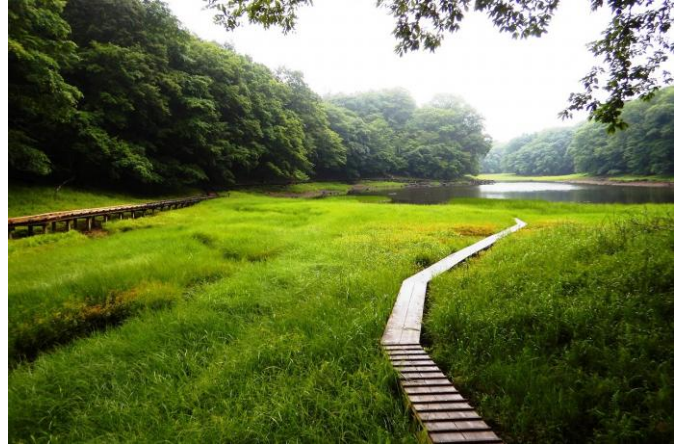
散策路からの大沼