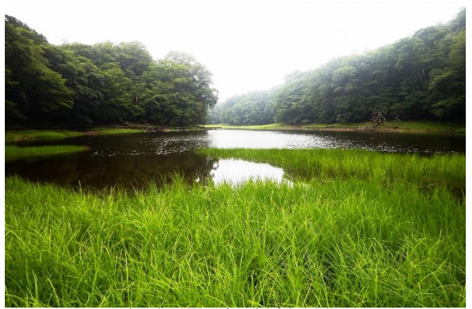
すっかり夏の森に包まれる大沼