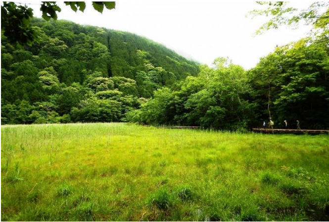
木道散策路からのヨシ沼の様子