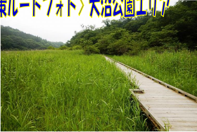
木道散策デッキを経由して大沼へ