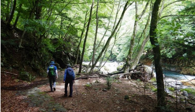
鹿股川沿いに散策路がある、自然研究路前山歩道区間