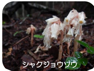
シャクジョウソウ