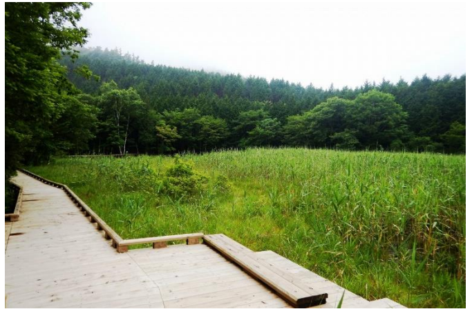
ヨシ沼観察デッキ (ハッチョウトンボ観察デッキ)