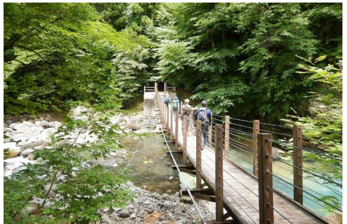
「仙人岩吊橋」ビジターセンターまではもう少し!