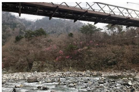
Sビジター施設対岸「セツ岩吊橋」 付近の箒川渓谷