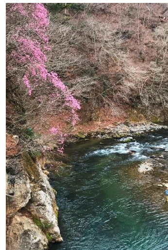
「塩湧橋」からの箒川渓谷 （塩釜温泉地区）