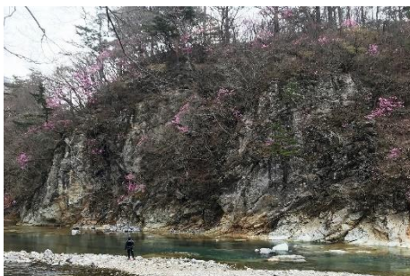
「セツ岩吊橋」上流付近