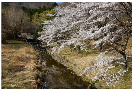
国道 400 号線「追沢橋」からの景観