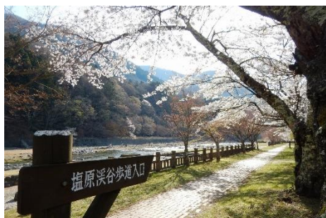
温泉街中心街の箒川沿いに延びる 遊歩道（古町・門前温泉地区）