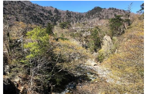
「鹿股橋」からみる鹿股川深谷