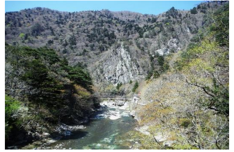
Sビジターはもう少し！ 国道400号「福渡橋」からみる天狗岩