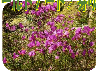
トウゴクミツバツツジ