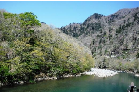
散策路からの箒川ダムとやしおコースの森