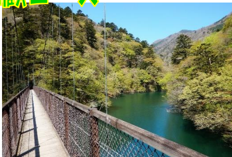
日々芽吹きが進む回顧の吊橋からの箒川溪谷