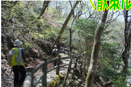
布滝観瀑台を目指す散策路