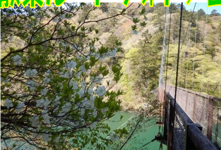
シロヤシオの花咲く回顧の吊橋

◆回顧コースは、現在通行止めとなっております。 墓石(がまいし)園地から回顧の滝観瀑台までの往復散策可能。