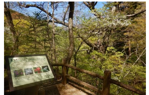
シロヤシオの花咲く散策路