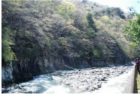
福渡温泉地区の散策路の様子