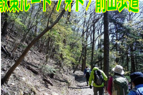
Sビジターから前山歩道を周回します！