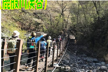
散策路「仙人岩吊橋」