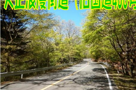
芽吹きの緑輝く大正浪漫街道の様子