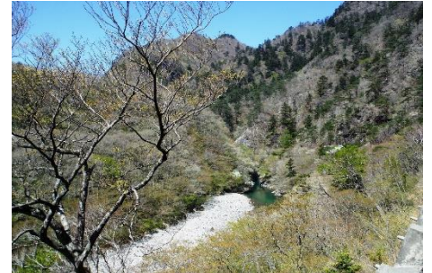
やしおコース箒川園地からの溪谷