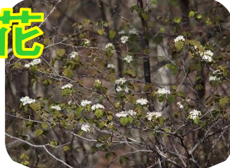
オオカメノキ (ムシカリ)