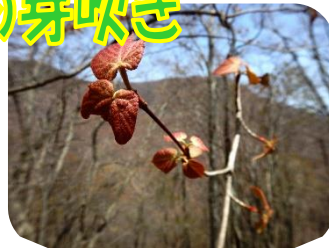
ヒトツバカエデ (紅葉は何色?)