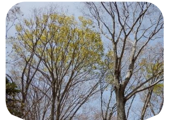
ブナの芽吹き (雄花が満開!)