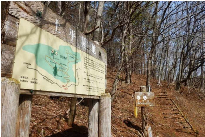
土平園地優雨歩道入口