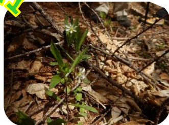
ヒゲネワチガイソウ