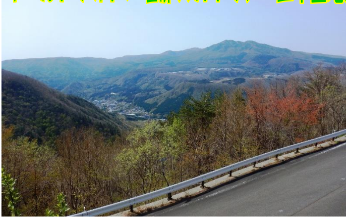
塩那スカイライン「展望広場」からの、温泉街と高原山系