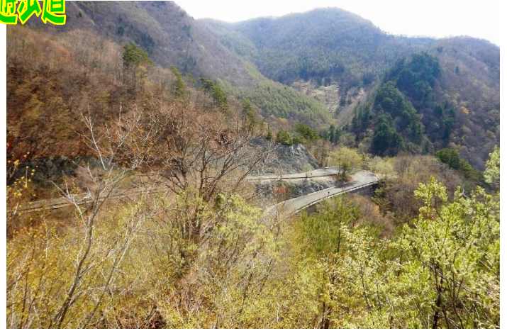
塩那スカイラインは、標高を上げるとまだ芽吹き森！