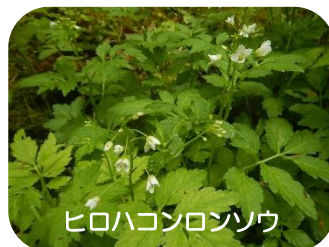
ヒロハコンロンソウ