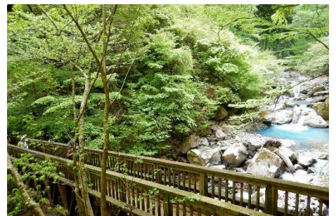
往復散策路最終地点「スッカン橋」