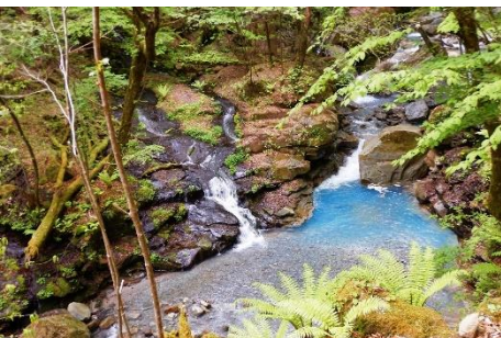
散策路からみる「スッカンブルー」