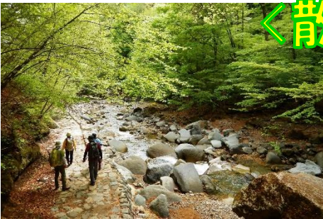
散策路は、スッカン沢の流れに沿って延びています。そのせせらぎを聞きながら！