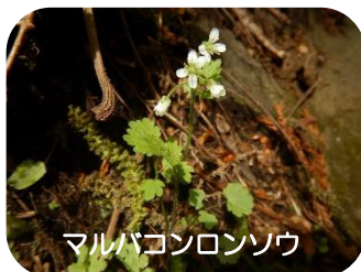
マルバコンロンソウ