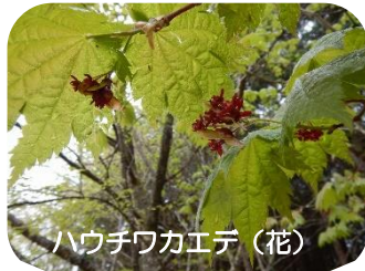
ハウチワカエデ (花)