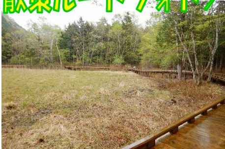
湿原エリアも日々緑の色彩に！