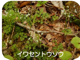
イワセントウソウ