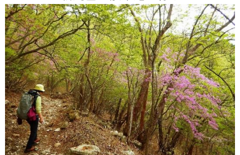
トウゴクミツバツツジ花のトンネル！