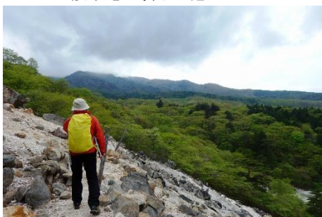
散策路「爆裂火口跡」からの眺望