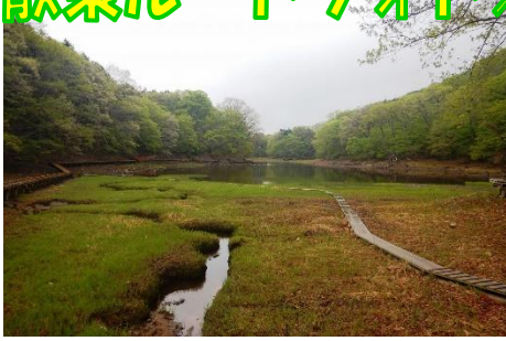
散策路「中央木橋」からみる大沼