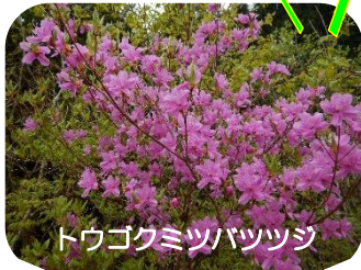
トウゴクミツバツツジ