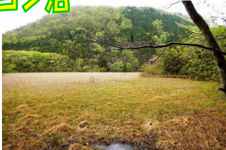
ヨシ沼木道散策路からの新湯富士