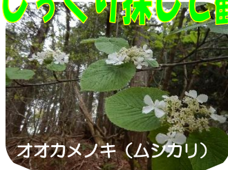
オオカメノキ (ムシカリ)