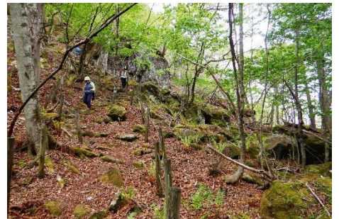
新湯富士散策路の様子