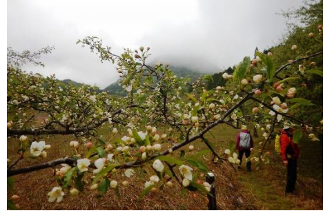
「ズミ」の花が、いよいよ開花しおりました！