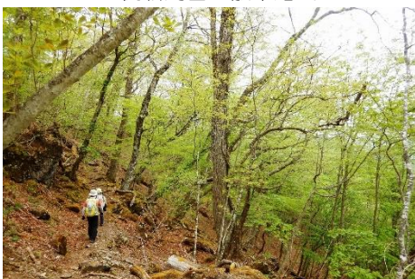
ミズナラの巨木が連なる散策路の様子