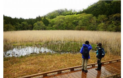
観察デッキからの湿原エリアの様子