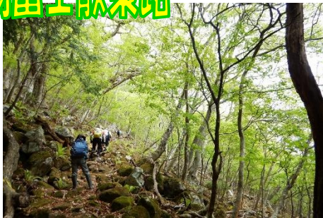
散策路山頂を目指して！