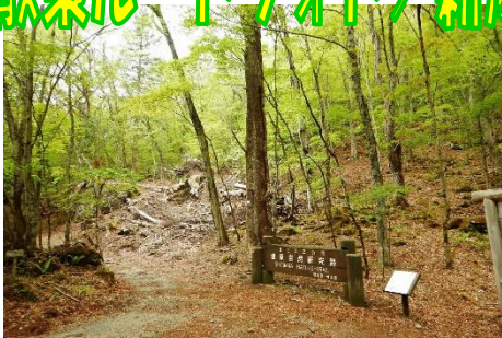
大沼側新湯富士散策路入口

◆大沼園地駐車場を拠点に、塩原自然研究路散策路を、新湯富士へ登り、ヨシ沼経由で周回散策もお勧めです！