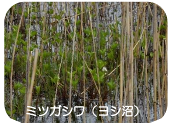
ミツガシワ (ヨシ沼)