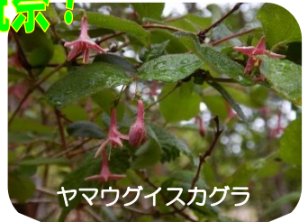
ヤマウグイスカグラ