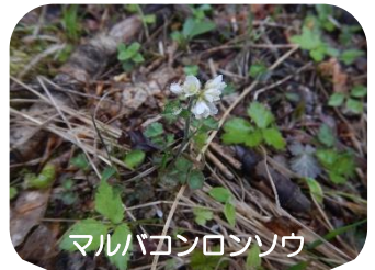
マルバコンロンソウ