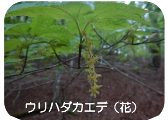
ウリハダカエデ (花)